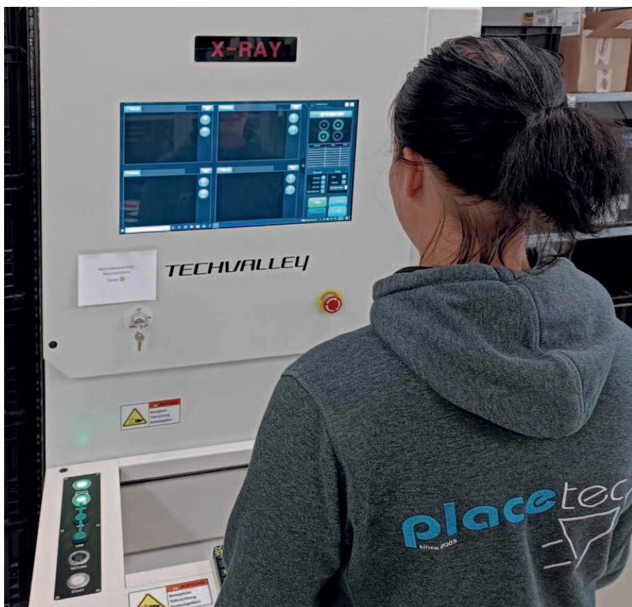
Genauer Überblick über den Lagerbestand durch Röntgenbauteilzählung.

Neben der SMD-Bestückung, auch von Longboards, bietet die Placetec AG aus Liestal bei Basel auch THT-Services.